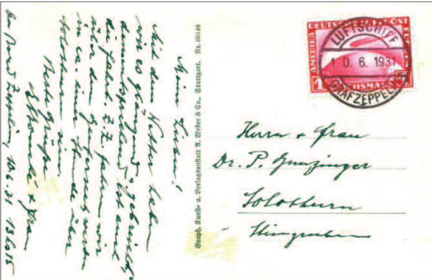
Solothurn Über dem Genfersee geschriebene und nach Solothurn adressierte Postkarte «...werden in ca. einer Stunden über Solothurn sein.»

Doch was soll das, die Motoren laufen langsamer, unser Tempo vermindert sich, ach ja, wir haben Pflichten zu erfüllen, Pflichten des Postillions, denn unmittelbar unter uns bewegen sich viele Leute, Militär, Kinder und sogar Postbeflissene können wir mit bloßem Auge erkennen, wir schweben nur noch, wir befinden uns über dem Lausanner Flugplatz, der Blécherette, da sollen unsere von Vaduz mitgenommenen Postsäcke wieder an Land abgegeben werden. Drei gelbe Fallschirme, jeder mit einem Postsack beschwert, verlassen mit einem Ruck unser Schiff und baumeln sanft der Mutter Erde zu, wo sie von flinken Händen in Empfang genommen werden, um deren Inhalt auf dem ganz profanen Wege mittels Bahn und Post den glücklichen Adressaten zuzuführen.