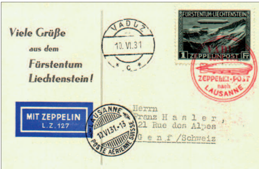
Liechtenstein Postkarte mit der Sondermarke zu 1 Franken.

Bei dieser Zeppelifahrt handelt es sich um keine gewöhnliche Fahrt, vielmehr wurde das Luftschiff vom Rotary Club aus dem schweizerischen Solothurn gechartert. Während also in Vaduz die Zeppelinpost eingeladen und in Lausanne wieder abgeworfen wurde, vergnügte sich an Bord der Solothurner Rotary Club.